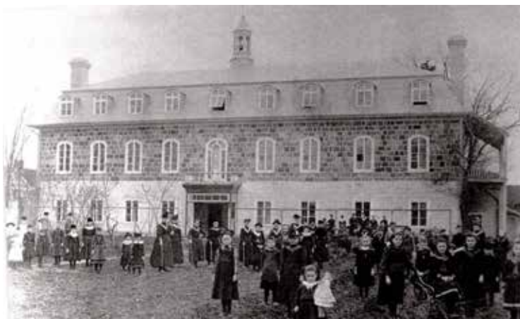
La plus ancienne image montrant le premier presbytère en entier, prise vers 1880 alors qu'il vient d'être exhaussé d'un étage plus un comble « à la française » à quatre pans.