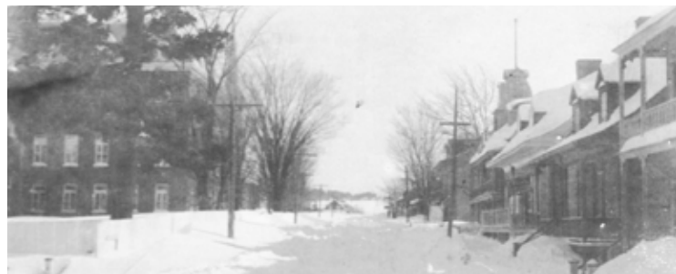
La rue Principale en 1908, alors que les chemins n'étaient pas déneigés. On remarque à gauche, de l'autre côté du gros pin, le couvent qui fait face à quelques maisons aujourd'hui disparues.

Les plus jeunes ne se souviennent pas du temps où les chemins n'étaient pas déneigés, pourtant une réalité dans le Québec d'autrefois.