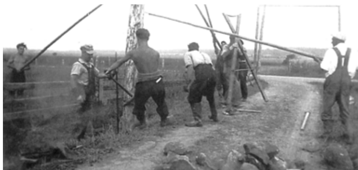
L'installation des poteaux électriques à l'été 1945 au Bras. Société historique de Bellechasse.

Le Peuple du 11 février 1938 rapporte les propos du député Émile Boiteau qui a annoncé que l'on vient d'installer l'électricité dans cinq paroisses de son comté : Sainte-Sabine, Saint-Magloire, Notre-Dame-Auxiliatrice-de-Buckland, Saint-Philémon et le premier rang de Saint-Gervais. Au congrès de l'Union Catholique des Cultivateurs, le 12 septembre 1944 à Saint-Paul-du-Buton, le curé Leclerc de Saint-Gervais adresse la parole aux participants. Parmi les plus importantes résolutions formulées, le groupe va demander aux gouvernements d'adopter des lois pour hâter l'expansion de l'électrification rurale de toute la province. Ce mouvement fait bouger les choses puisque Le Soleil du 4 avril 1946 mentionne que les travaux d'électrification rurale entrepris par la compagnie électrique Shawinigan Water & Power dans tous les rangs de la paroisse Saint-Gervais sont terminés et les cultivateurs de cette localité ont désormais le service de l'électricité.